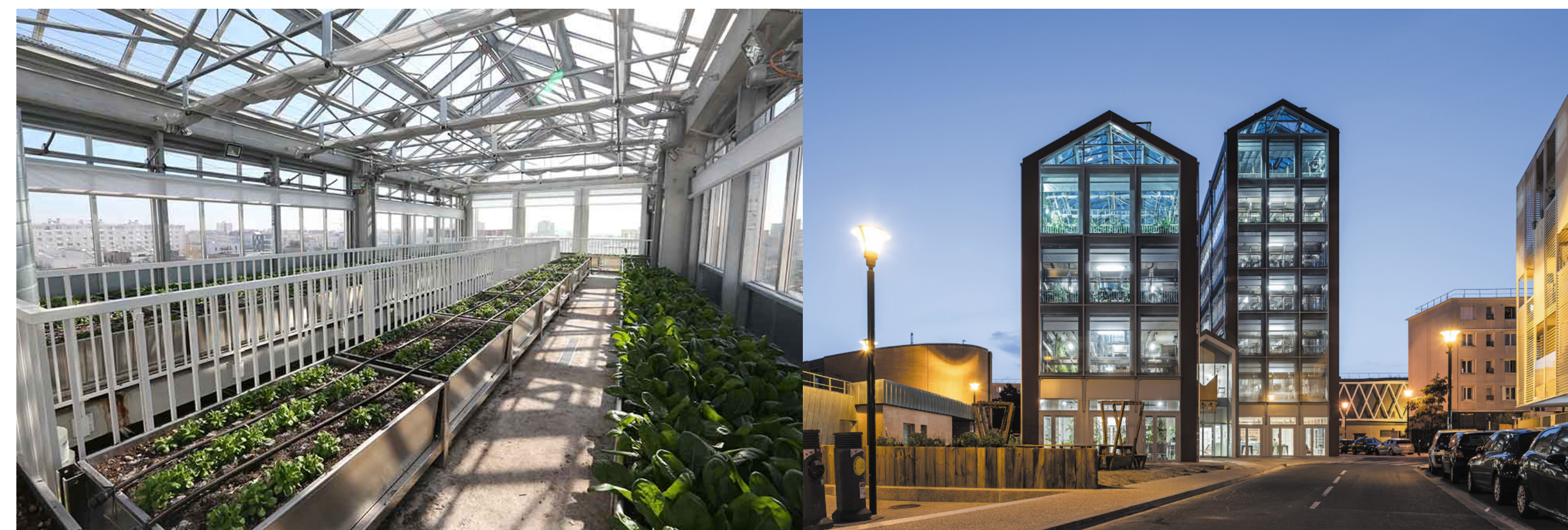
La Cité Maraîchère

La Ville de Romainville, l'Etat, et plus particulièrement la DRIEAT Île-de-France, la Direction régionale et interdépartementale de l'environnement, de l'aménagement et des transports.