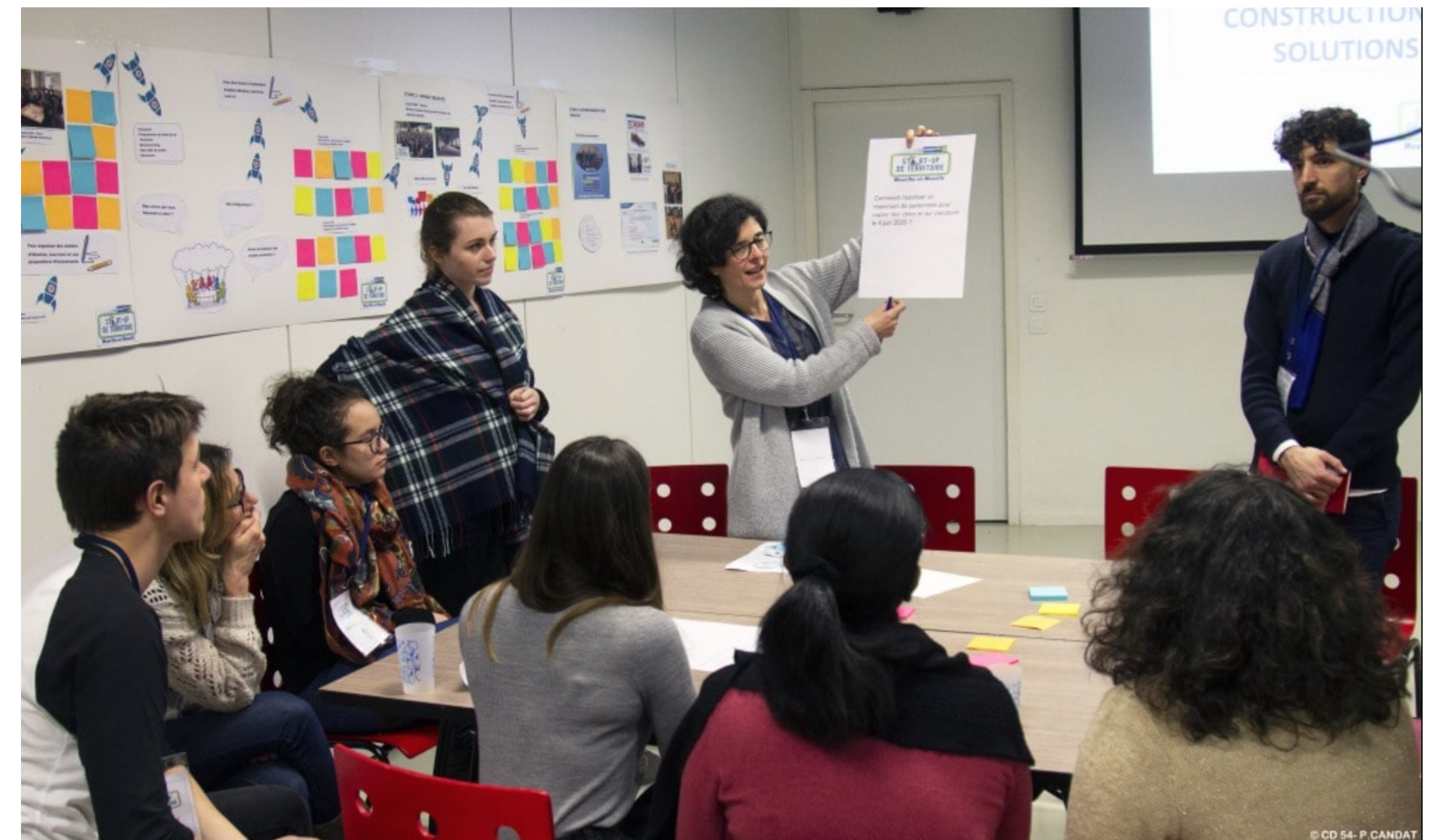
Lancement de Start Up de territoire par le collectif EssenCiel 54 • 27 janvier 2020, Nancy

Réseaux d'acteurs engagés, des entrepreneurs engagés, des citoyens engagés, des entreprises partageant les valeurs de ESS, l'Université de Lorraine – La CRESS Grand Est - France Active Lorraine, le Département de Meurthe-et-Moselle et autres institutionnels.