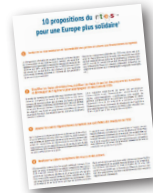
10 propositions du RTES pour une Europe plus solidaire

En s'appuyant sur les actions et politiques des collectivités, le RTES contribue et alimente les débats liés aux politiques publiques et à l'économie sociale et solidaire.