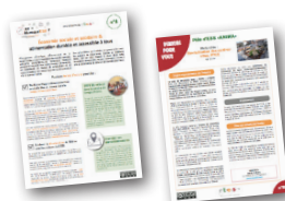
Fiche du kit MunicipalESS et fiche «Déniché pour Vous»