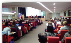
Séminaire «Politique de la ville & ESS» à Paris