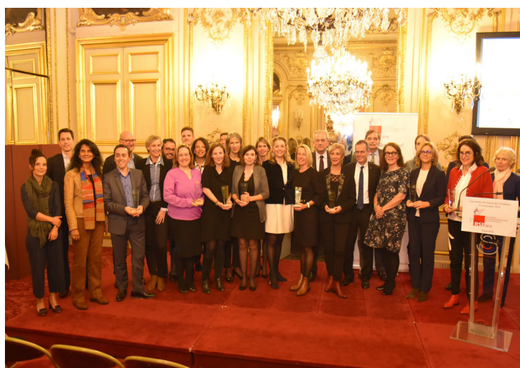
Partenaires et Lauréats 2019