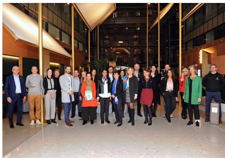
Partenaires et Lauréats 2021