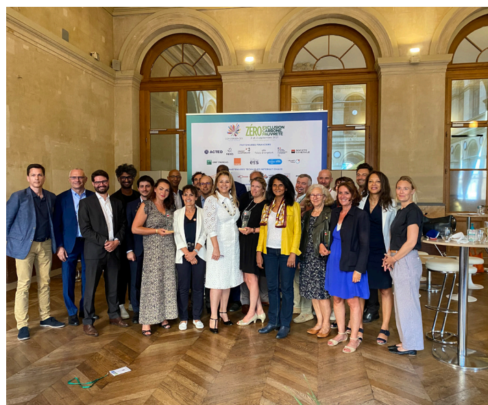
Partenaires et Lauréats 2020