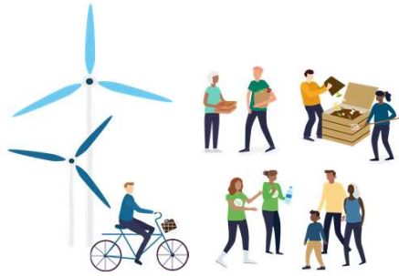
Structures de l'ESS de la transition écologique

Développement et structuration des structures de l'ESS dont le cœur de métier a trait à un secteur de la transition écologique