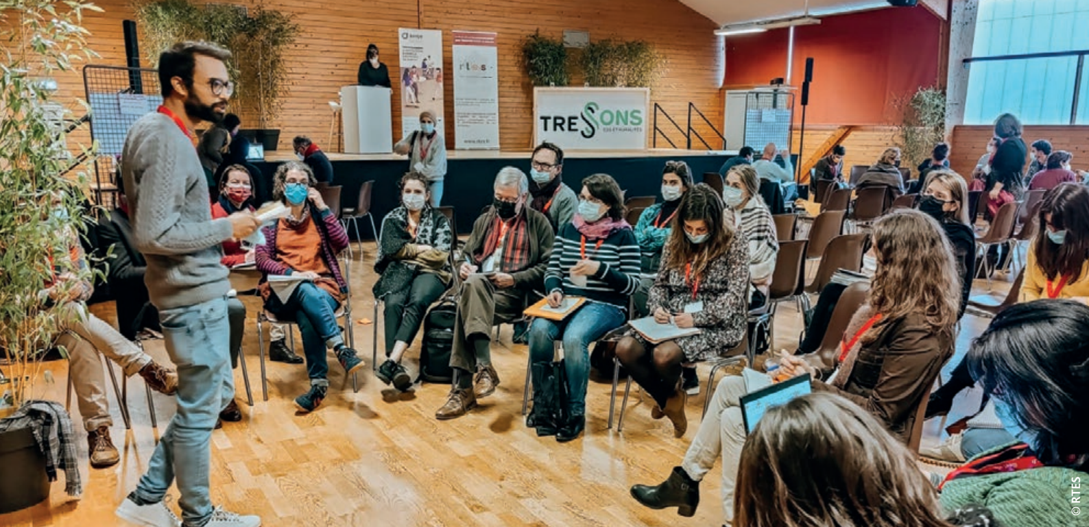
Séminaire de clôture du projet TRESSONS, organisé les 6 et 7 décembre en Bretagne en présence d'une centaine de participants.