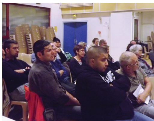
■ Un auditoire attentif.