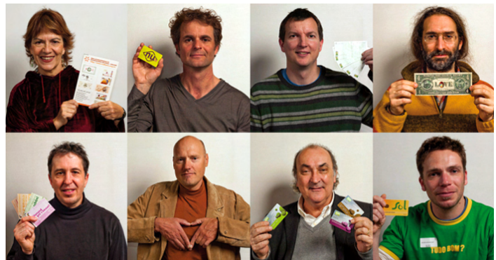
Echanger autrement ! panorama des monnaies complémentaires et sociales fokus 21

Lors de la Journée d'échanges du 9 novembre, vous aurez le plaisir de découvrir ou redécouvrir une exposition photographique de 18 portraits emblématiques , parmi les 4 000 monnaies existantes dans le monde. Chaque créateur ou porteur de monnaie pose avec son système d'échange (billet, téléphone, carte à puce...) dont l'objectif est de remettre de l'abondance, de la diversité, du lien, de la démocratie et de l'humain dans l'économie.