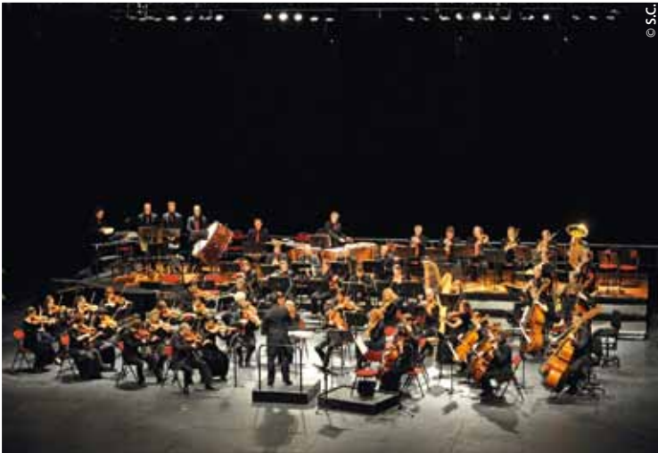
8 janvier - Le concert du nouvel an interprété par l'orchestre de Montbéliard-Besançon Franche-Comté à l'Axone fut un succès.