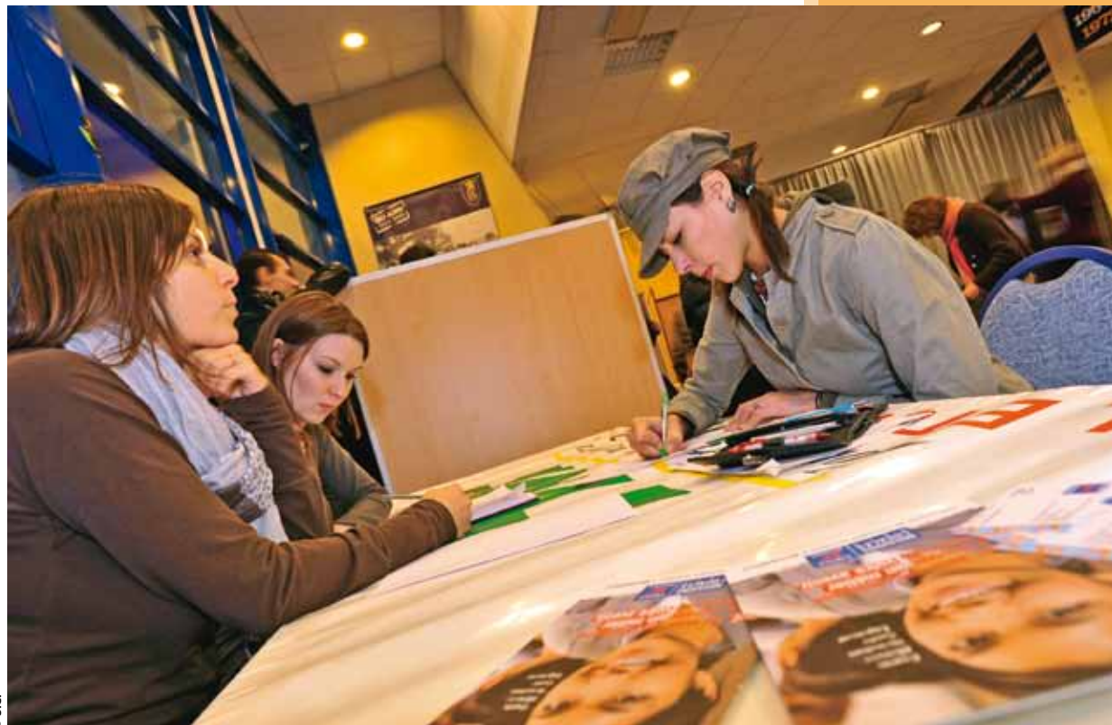
Les prochains rendez-vous de l'emploi de Bonal concernent une trentaine de jeunes et cinq recruteurs.