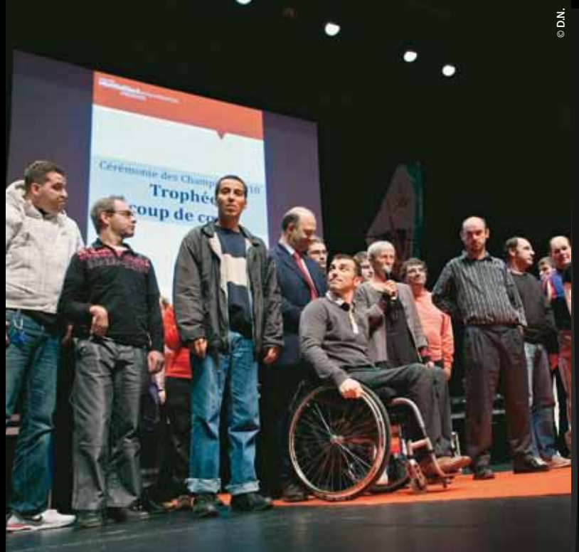
10 décembre - La Mals à Sochaux accueillait la première édition de la cérémonie des champions. L'occasion pour Pierre Moscovici et les élus de Pays de Montbéliard Agglomération de récompenser les sportifs qui ont porté haut les couleurs de l'agglomération en 2010.