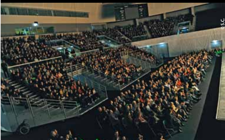
Près de 2 000 personnes se sont pressées dans les gradins pour écouter le Boléro de Ravel.