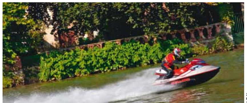
Le jet-ski sera l'un des sports mécaniques présentés au salon.