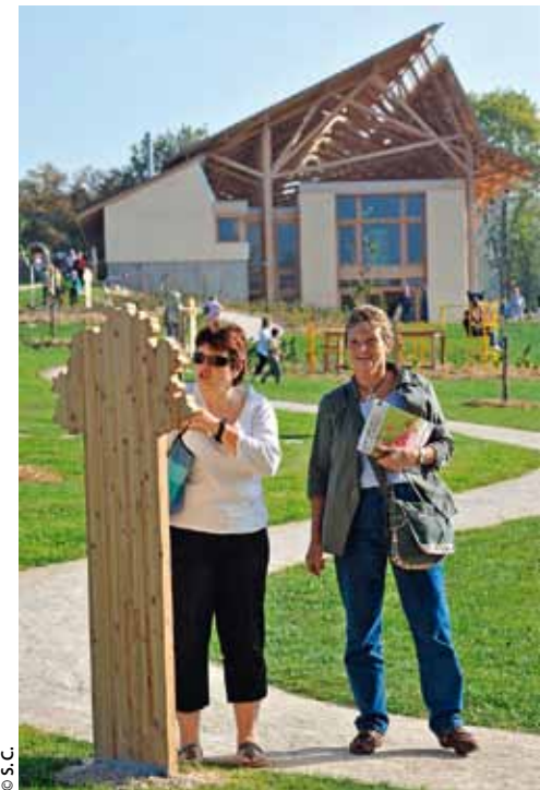
Venez découvrir la Damassine en toute décontraction !