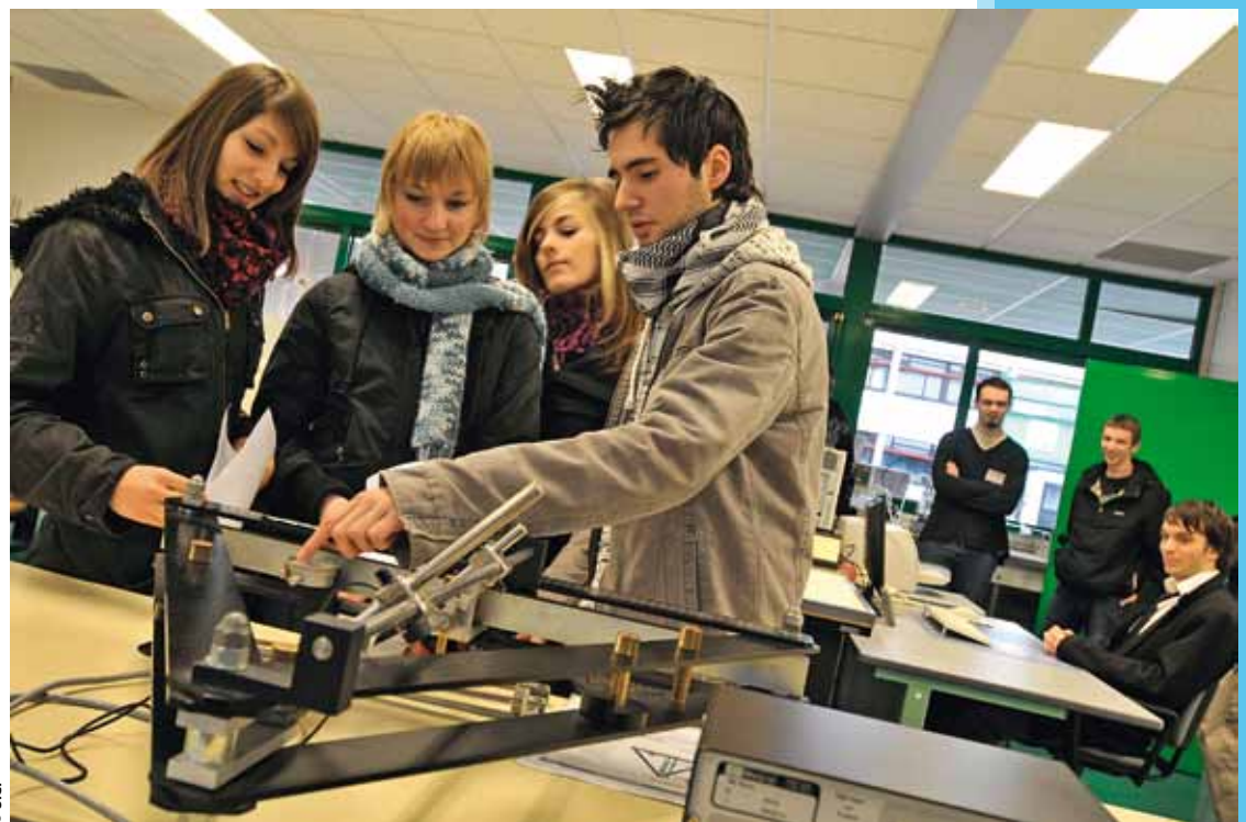
Lycéens, parents et étudiants pourront prendre des renseignements sur les filières présentes dans l'Aire urbaine.