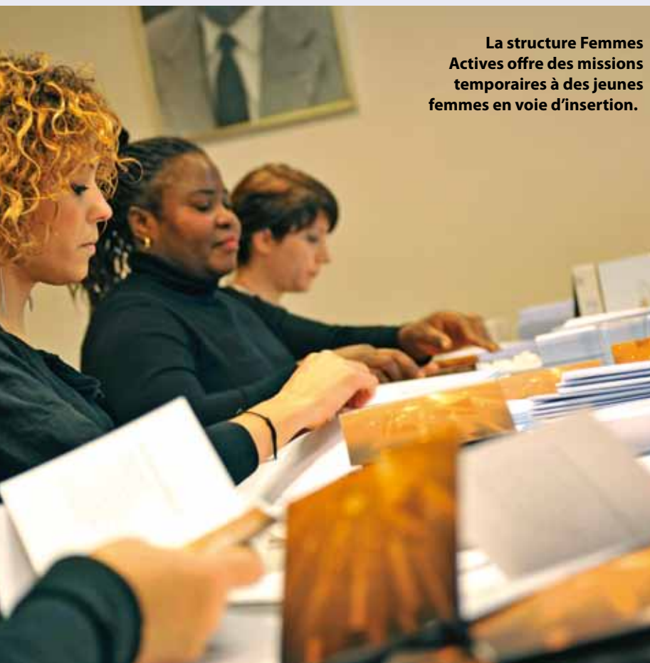
La structure Femmes Actives offre des missions temporaires à des jeunes femmes en voie d'insertion.

Pays de Montbéliard Agglomération mène une politique volontariste de soutien au développement de ces initiatives et obtient des résultats probants. Nous pilotons le Plan local pour l'insertion et l'emploi dont bénéficient 1 400 personnes en grande difficulté sur le marché du travail. Notre collectivité a aussi adopté une charte de l'achat socialement responsable avec une clause qui prévoit de faire travailler des publics en insertion sur chacun de nos chantiers importants. Nous passons des conventions avec certaines associations comme le Centre d'Information sur les Droits des Femmes et des Familles (CIDFF), nous mettons à disposition de certaines structures des locaux comme pour la banque alimentaire du Doubs, nous organisons des manifestations comme la journée de l'économie sociale et solidaire, nous menons deux programmes de solidarité internationale à Zimtanga au Burkina, et à Kab Elias au Liban... La question posée est bien celle des alternatives à imaginer et qui interrogent sur nos choix de société car l'implication des structures répond à des besoins sociétaux. ■