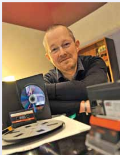
Le magasin Objectif Clip a bénéficié de l'aide du pôle d'économie solidaire d'Audincourt.

représente environ 10 euros par mois pour chacun d'entre eux), peut accorder un prêt à taux 0 jusqu'à 1 500 euros. Ainsi, depuis douze ans, ce sont près de cent entreprises qui ont bénéficié d'un prêt pour un résultat très positif : « 68 % des entreprises que nous avons soutenues existent toujours aujourd'hui et ont créé des emplois ». Au-delà de ces créations d'activités, le pôle local d'économie