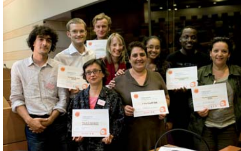
Remise des prix CréaRif 2008

• Découvrez la convention d'affaires CréaRif CréaRif est la convention d'affaires dédiée au développement des projets régionaux