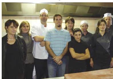
L'équipe de Saveurs et créations toujours prête pour créer.